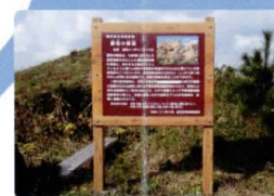
蛇岩についての詳細が かいてあるよ。