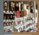
神楽ショップくわの木

豪華絢爛な舞衣が確立したのは大正時代以降のこと。立体的な刺繍、ヒゲにはヤギの毛、目にはガラス玉を使用し、舞衣によっては1着で20kgほどの重さがある。同じ舞目でも神楽団体によって表現方法異なるため舞衣は全てオリジナル。職人による手こぎで作られ、1着が仕上がるのに数ヶ月を要する。